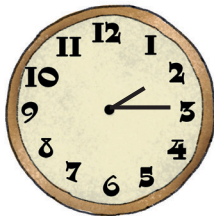
Vira toqghod taħseb x'għamlet hażin.